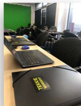
Jongeren uit Amsterdam Nieuw-West kregen een TekkieWorden Workshop. In 6 weken leren 20 jongeren in de leeftijd 15 - 21 een website en webshop te bouwen. Een samenwerking tussen TechConnect (TekkieWorden), Studiezalen en FutureNL.

Wij nodigen jouw organisatie uit om mee te doen.